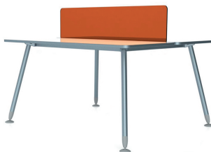
БЕНЧ-СИСТЕМА ERGOSTOL VITA MAXI