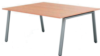
БЕНЧ-СИСТЕМА ERGOSTOL LONDO