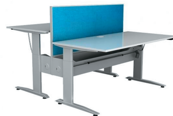
БЕНЧ-СИСТЕМА ERGOSTOL 501-15