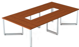
СТОЛЫ ДЛЯ ПЕРЕГОВОРОВ