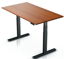
СТОЛЫ, РЕГУЛИРУЕМЫЕ ПО ВЫСОТЕ