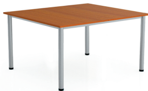
БЕНЧ-СИСТЕМА ERGOSTOL NEROD