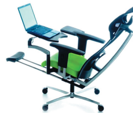
СТУЛЬЯ И КРЕСЛА