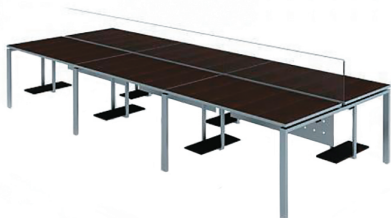
БЕНЧ-СИСТЕМА ERGOSTOL PETRA

ШИРОКИЙ АССОРТИМЕНТ ДИЗАЙНА РАМ И ЦВЕТОВОЙ ПАЛИТРЫ СТОЛЕШНИЦ