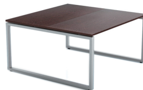
БЕНЧ-СИСТЕМА ERGOSTOL SECTOR